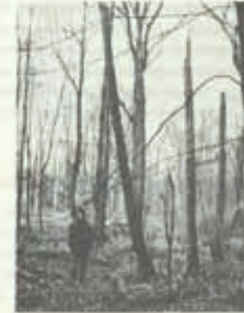
Abb. 1: Nach Grundwasserabsenkung abgestorbene Erle ( Alnus glutinosa )

Die einzelnen Holzarten reagieren in unterschiedlichen Ausmaß. Am empfindlichsten auf die Grundwasserabsenkung hat die Erle ( Alnus glutinosa ) reagiert, die fast vollständig abgestorben ist. (Abb. 1). Bei der Eiche ( Quercus robur ) sind ältere Bäume stark zapftrocken geworden, mittelalte Bestände zeigten eine übermäßige Trockenspitzeigkeit. Auffällige Trockenschäden sind auch an Pappeln ( Populus ) entstanden (Abb. 2). An anderen Holzarten traten keine äußerlich deutlich erkennbaren Erscheinungen hervor.