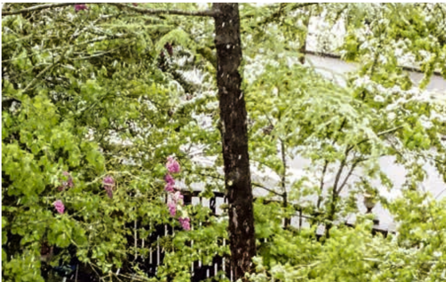
Das Grundstück leidet bereits von zwei Seiten unter Grundwasser-Absenkungen Infolge Neubau - Mega - Flachdachbauten : Die Tanne im Vordergrund ist bereits fast abgestorben.