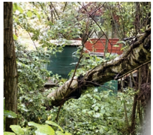
Im Mai 2018 umgestürzte 80-Jahre alte Birke auf dem Areal Bahnhofstrasse 48, vor dem "Sieglinshof", keineswegs abgestorben, aber geschwächt durch bereits vorhandene Grundwasser-Absenkungen von zwei Seiten infolge überdimensionierter Neubauten.