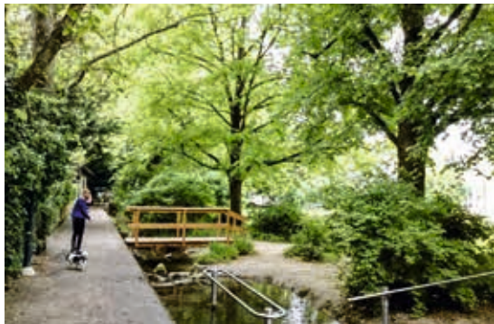
Links: Dieses Brunnwegli müsste zubetoniert werden für die Ersatz- Strasse zum Dorfplatz

Alternativ wird das Frühmesswegli als Ersatz-Str. überlegt. Dazu müsste aber nebenan der "Schlipf" abgerissen werden! Diese "Option" ruht seit 1974 nach wie vor in Behörden - Schubladen! (Deshalb gibt es nie langfristige Verträge für den "Schlipf") So eine neue Strasse muss, zumindest für Krankenwagen, Taxi, Feuerwehr und Polizei, von der Bahnhofstrasse zum Gemeindeplatz führen, was als "offengehaltene Option" auch schon lange, seit 1952, in Behördenschubladen schlummert.