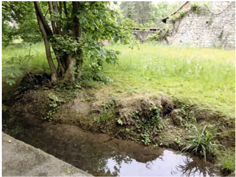
Ecke Bahnhofstrasse/Brunnwegli: Dieses Biotop (mit Barocktrog s.u.), samt dem Bächli, würde zubetoniert für die unerlässliche Ersatz-Strasse (für die Schmiedgasse!) zum Dorfplatz. Votieren Sie dafür, dass hier der Gegenentwurf des Kleinst-Kinder-Spielplatzes realisiert wird!