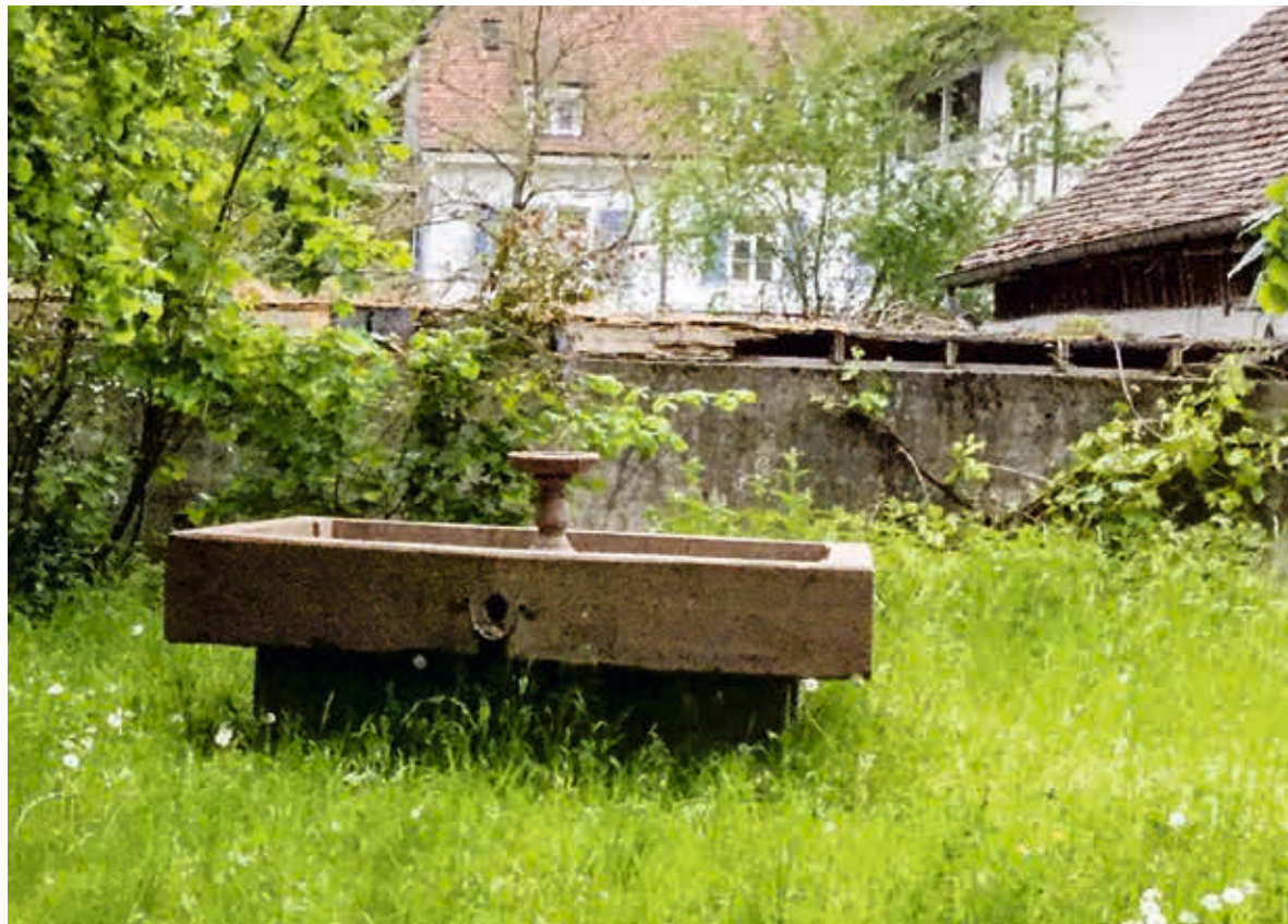
Einsam auf dem romantischen , hoffentlich zukünftigen KleinstKinder-Zentrum Rosegärtli, Ecke Bahnhofstr./Brunnwegli mit Immenbächli : Barocker SandsteinTrog zum Plätschern für Dreijährige