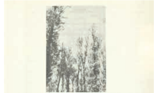
Abb. 1: Schäden an Pappelbeständen nach einer Grundwasserabsenkung.

Aufgrund dieser Beobachtungen kommen wir zu der Feststellung, daß nur einige Holzarten typische Symptome nach einer Grundwasserabsenkung zeigen.