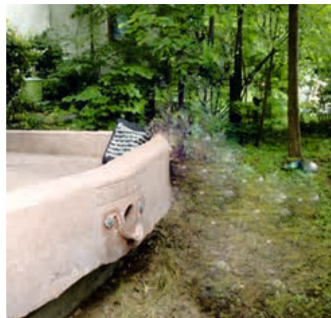
Barock-Trog im Rosegärtli als Planschbecken für unsere Kleinsten